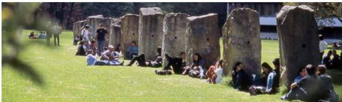
Estudiantes y lugar. Monolitos. Trabajo de grado de la Escuela de Artes Plásticas y Visuales en la década de los noventa.

Izquierda: Décima máquina Kriptomaquinoantropomórfica de Bogotá. Interacción con el exterior para proyecto pedagógico – académico de la Escuela de Diseño Industrial y la Especialización en Educación Artística Integral. Derecha: Apropiación de la Plaza central, programa Plan C de la Vicerrectoría de sede.