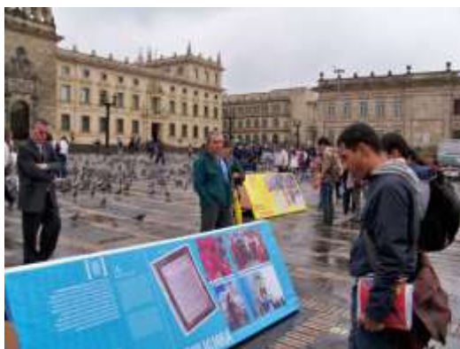
Inauguración de la Exposición Carnaval.

poner en práctica la dimensión lúdica de la museología a través de talleres de máscaras para armar, en el que se vinculó al público infantil y a familiar fundamentalmente.