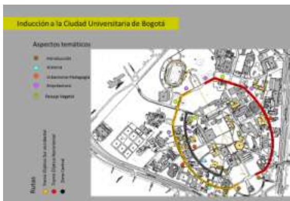
Plano guía para la implementación del recorrido Ciudad Universitaria de Bogotá CUB. Autor: Alejandro Armesto