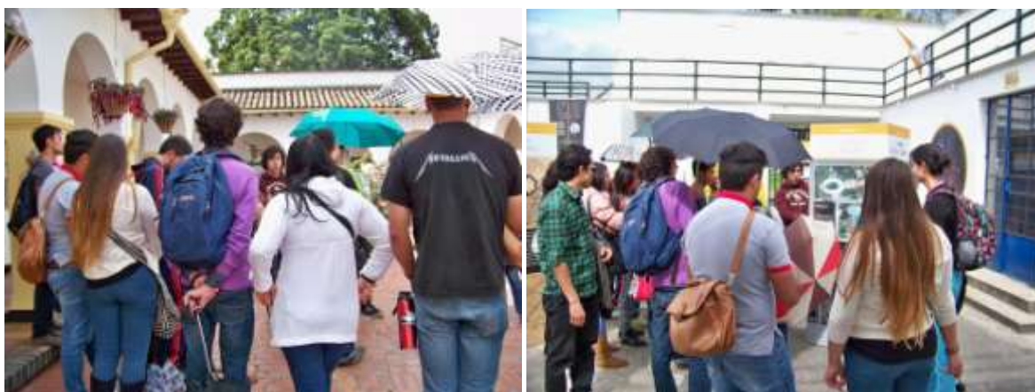
Visitas guiadas a las exposiciones. Visita a la exposición Antiguo Instituto Botánico (imagen izquierda) Visita a la exposición Estadio Alfonso López (imagen derecha) Junio y julio de 2014

En el proceso surgió otra iniciativa de proyecto museográfico, proveniente de la Dirección de Bienestar estudiantil, con ánimo de aunar esfuerzos para difundir el patrimonio inmaterial de la CUB. La importancia del tema y la disponibilidad de cooperación de la Dirección de Museos y Patrimonio Cultural - DMPC, se concretó con una nueva alianza que permitió el desarrollo e inauguración de la Exposición “Carnaval UN. De la Ciudad Universitaria a la Ciudad Festiva en Bogotá”