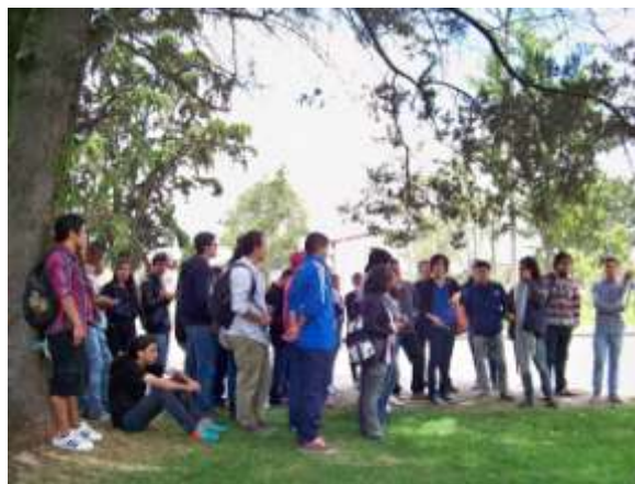
Recorridos por la CUB Julio de 2014.