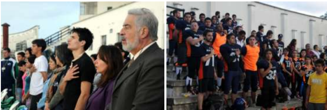
Inauguración de la Exposición Estadio Alfonso López, proyecto de DMPC y UNIMEDIOS.