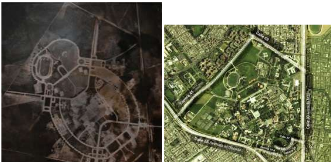
Vistas aéreas de la Ciudad Universitaria en 1943 y en 2012

El proyecto original de Ciudad Universitaria no logra culminarse, debido a cambio de políticas gubernamentales a partir de los años cincuenta, y especialmente desde el Frente Nacional. De esta forma la evolución y conformación de la CUB entra en otras dinámicas de desarrollo. El proyecto inicial queda como parte de su historia constructiva, y se suman otras miradas de construcción e intervención del espacio, que si bien afectan el orden armónico matriz, crean un paisaje complejo que sustenta la valoración como paisaje cultural e histórico, conformado por: el plan original a nivel pedagógico, urbanístico y arquitectónico; los pensamientos y prácticas académicas y culturales, y un componente vegetal arbóreo, que además de ser hábitat de especies de aves e insectos, se constituye como elemento articulador del componente ecológico de la ciudad de Bogotá, al permitir una conexión entre los cerros orientales y la sabana occidental.