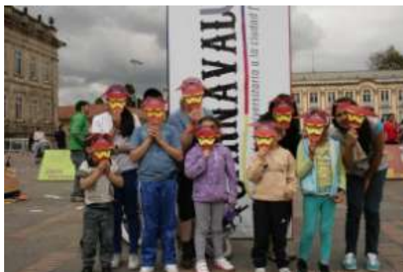
Taller de máscaras para público infantil.